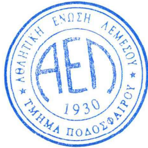
ΝΙΚΟΣ ΧΡΙΣΤΟΔΟΥΛΙΔΗΣ ΠΡΟΕΔΡΟΣ ΑΕΛ ΛΕΜΕΣΟΥ